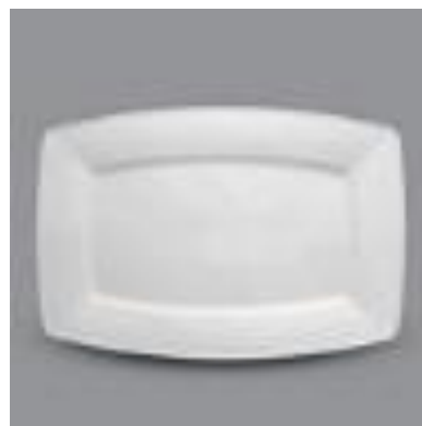
VICTORIA SERVICE 32CM 34$ UN