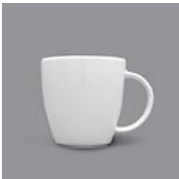
VICTORIA MUG 035LT/11,5oz 8$ UN 030LT/10oz 6$ UN