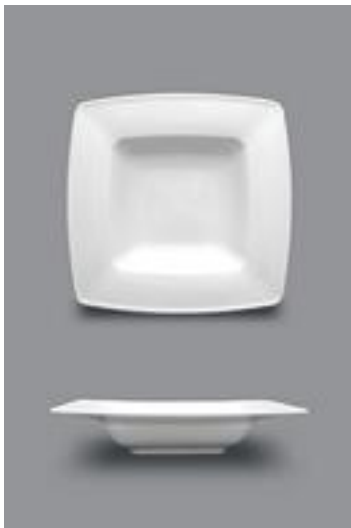
VICTORIA SOUPE/PASTA 23CM 16$ UN 27CM 20$ UN