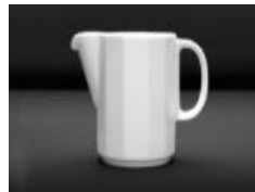
CRÉMIER CREAMER 015 LT 7 oz UN 8.60$