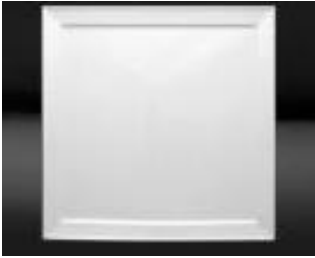
RITA-26 26CM X 26CM UN 41$