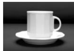
TASSE SOUCOPE CUP SAUCER 020 LT 7 oz DZ 86.40 010 LT 3.5 oz DZ 75.60$