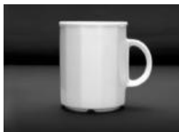
GOBELET MUG 030 LT 10 oz DZ 66$