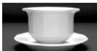
BOUILLON BROTH 030LT 11OZ DZ 127.20$