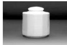
SUCRIER CVR SUGAR 020 LT 7 oz UN 11.20