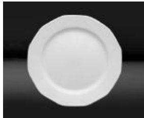
ASSIETTE PLATE 30 CM 11.75" UN 18$ 25 CM 9.75" DZ 127.20$ 19 CM 7" DZ 86.40$ 16 CM 6.5" DZ 55.20$