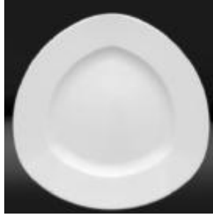
RITA-TRI 31CM X 31CM UN 27$