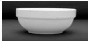
RITA-15 UN 12$ 16OZ