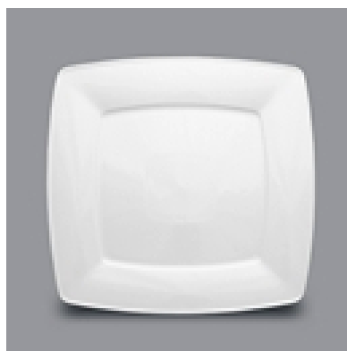
VICTORIA PLAT 28CM 28$ UN 26CM 18$ UN 21CM 16$ UN 19CM 14$ UN

VAISSELLE BLANCHE/RESTAURATION HOTELWARE ALL WHITE DISHES