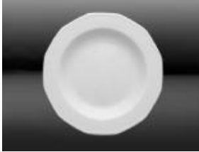
ASSIETTE CREUSE DEEP PLATE 22 CM 8.75" DZ 86.40