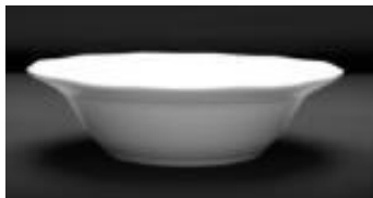
BOL BOWL 21 CM 18 oz DZ 129.60$ 18 CM 12 oz DZ 96$ 15 CM 6 oz DZ 69.60$