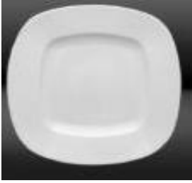
RITA-320 29.5 X 29.5 CM UN 18$