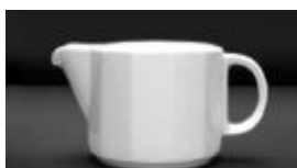
SAUCIER GRAVY 11OZ UN 10$