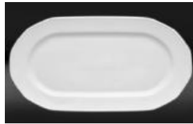
PLATEAU OBLONG OBLONG PLATTER 38 CM 15" UN 37$ 29 CM 11.5" UN 18$